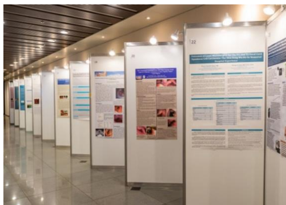
7.海報區 共 30 篇論文