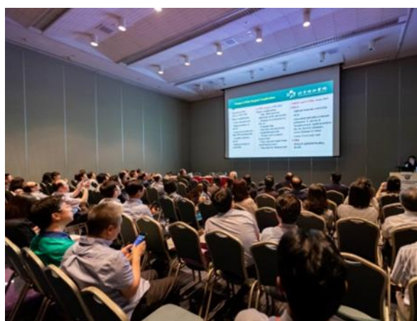
9.眼科白內障及屈光手術單元會場