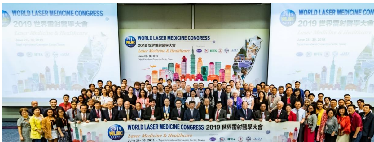
3. 2019 WLMC 開幕式 國外貴賓合影