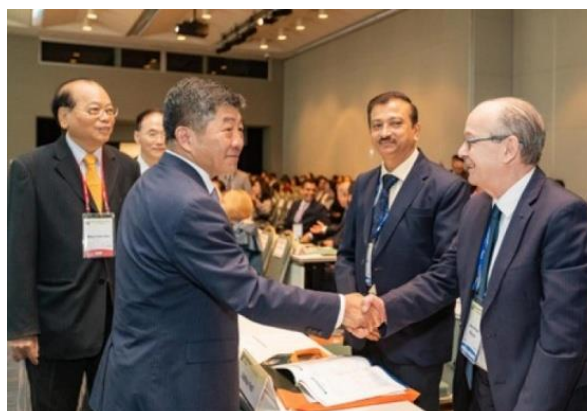
5.衛福部陳時中部長蒞臨致詞