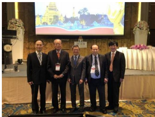
2. 曼谷會議中確定 2019 WLMC 在台灣主辦